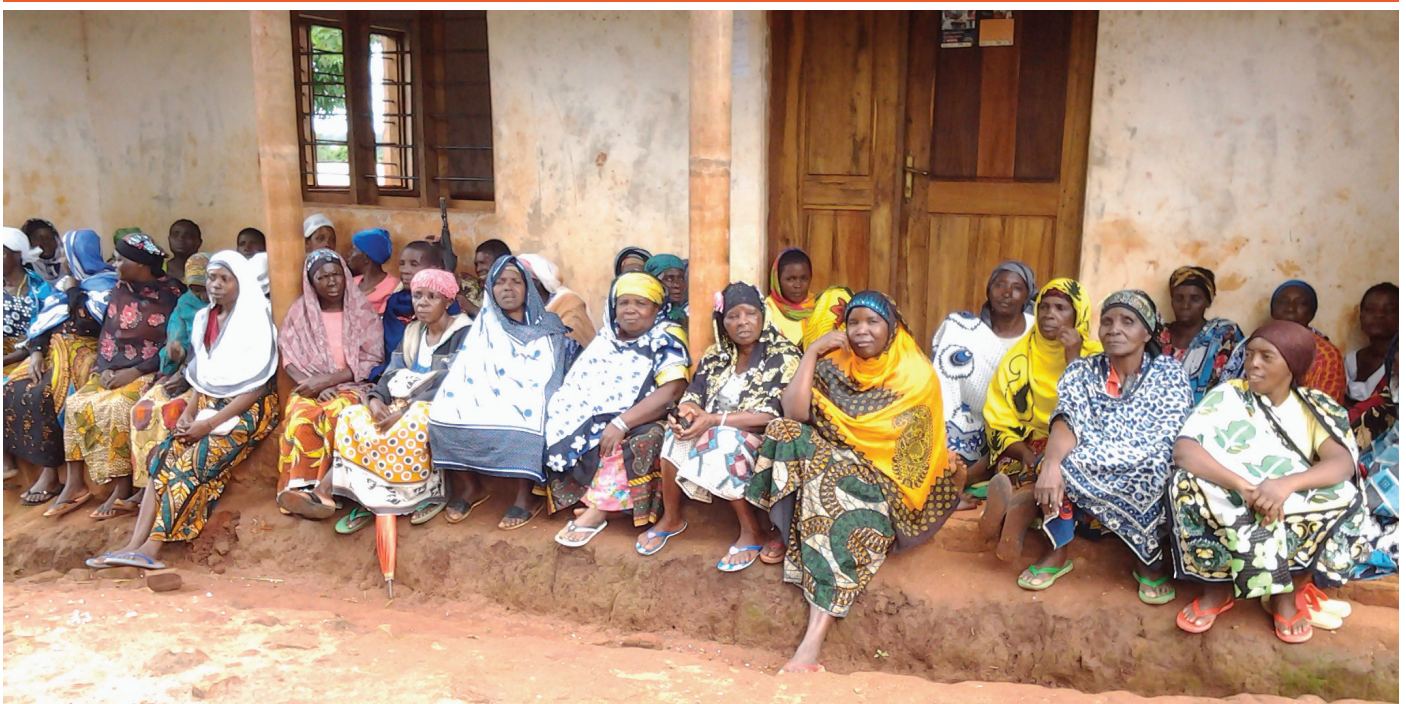
Wanufaika wa TASAF mtaa wa Ruvuma Chini wakisubiri ku pata ruzuku ya Tasaf, mwezi machi 2017